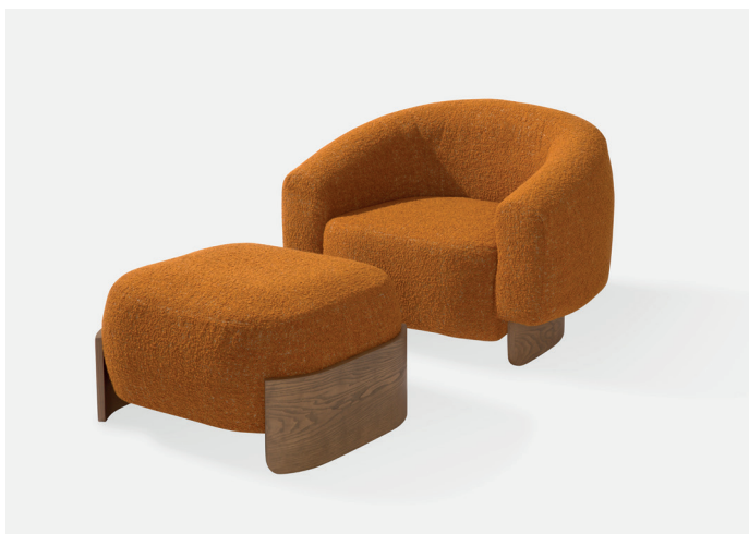
Betty poltrona / armchair