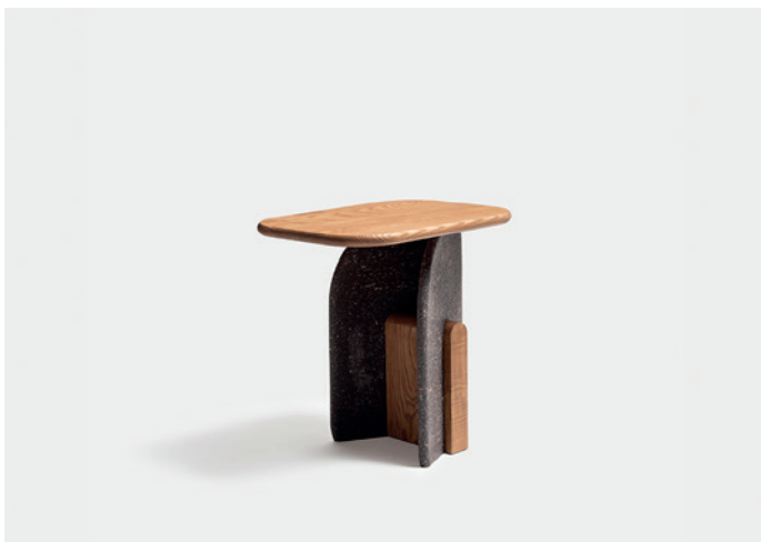
Slabs, piano e blocco base legno, gambe marmo