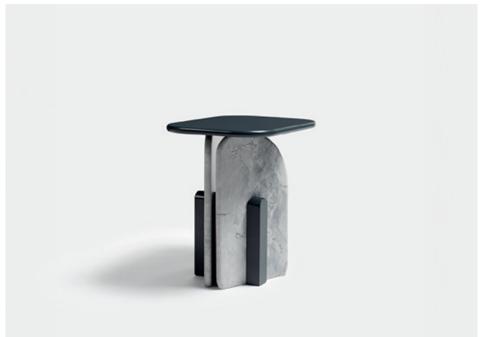
/lacquered base and top, marble legs