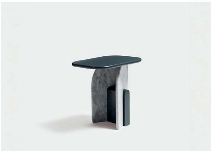
Slabs, piano e blocco base laccati, gambe marmo