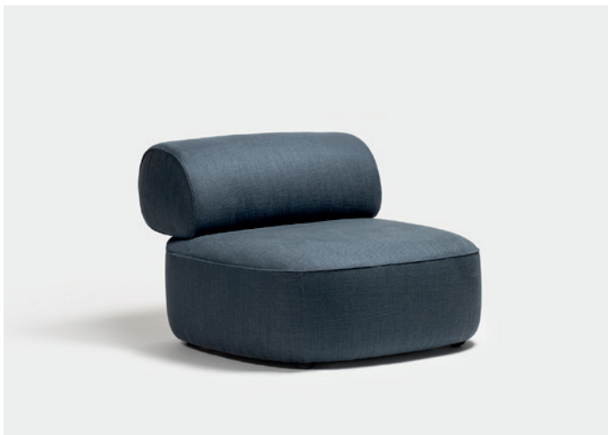
colonna legno /wooden backrest support