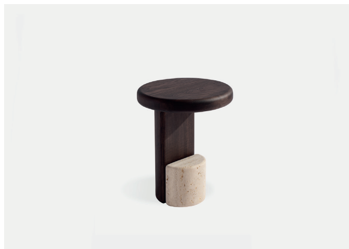
Milestone – blocco marmo /marble block