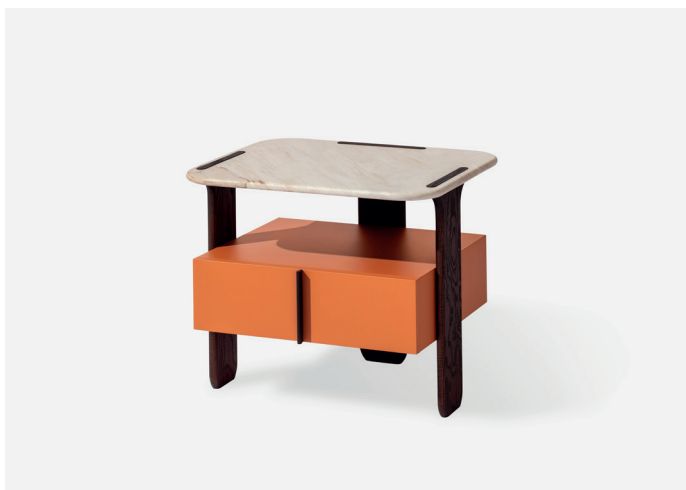
Trio N – piano marmo /marble top

(en) / Bedside table with body, legs and handles made of ash wood. Undertop, drawers and top in wood fiber panels. Drawer sides and back in Tanganika-veneered blockboard. Drawer bottom in poplar plywood, upholstered in econabuk. Completely adjustable guides. Matt lacquered structure, available with matt lacquered top or marble top with a thickness of 20 mm.